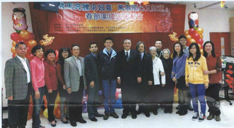
參加萬華老人中心春節圍爐活動