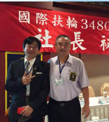
參加3480地區社秘聯誼會