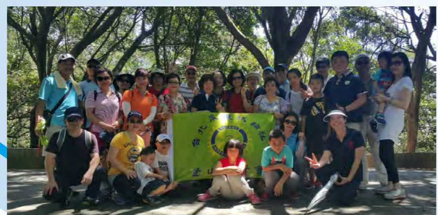
登山會聯誼7/5、鶯歌石步道