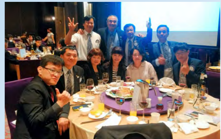
參加中和及安、台北及美社聯合交接典禮