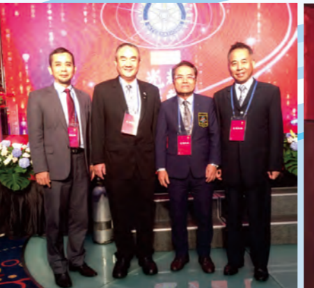
參加光耀扶輪慶功晚宴