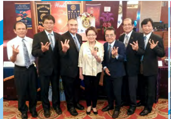
參加雙和扶輪社社長交接典禮