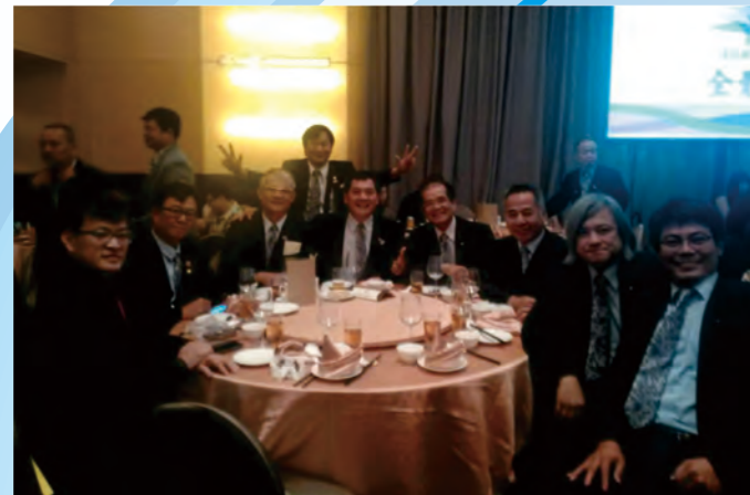
參加大台北扶輪社授證暨交接典禮