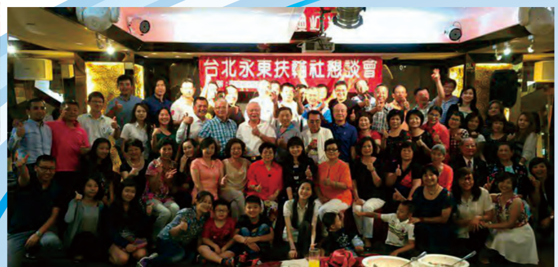
7/24第一次爐邊會Steel社長作東於板橋吉立餐廳/ 社務行政主委Computer專題報告