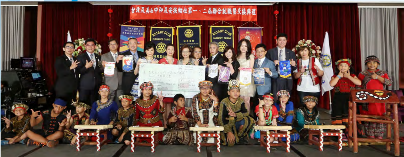
第六分區聯合社區服務--四族九器捐贈儀式