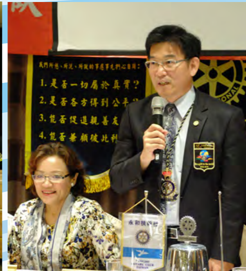
與永和社共同例會