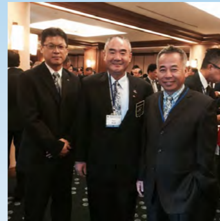
參加社員發展研習會