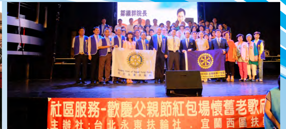
8/20於青少年育樂中心主辦歡慶父親節紅包場-懷舊老歌欣賞