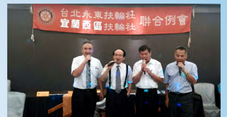
與兄弟社宜蘭西區社聯合例會