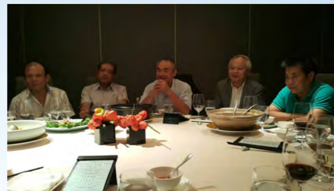
舉辦新社友教育座談會