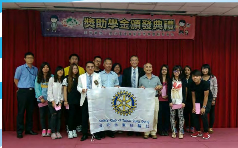
9/4參加新北市家扶中心大專生獎助學金頒獎典禮