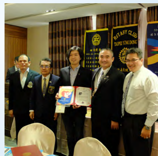
歡迎Archi新社友佩章入社