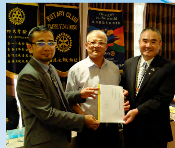
第十七、十八屆財務交接