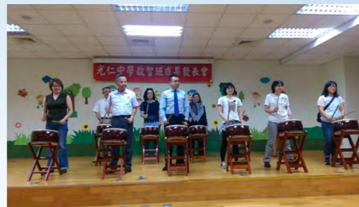
參加光仁中學啟智班成果發表會