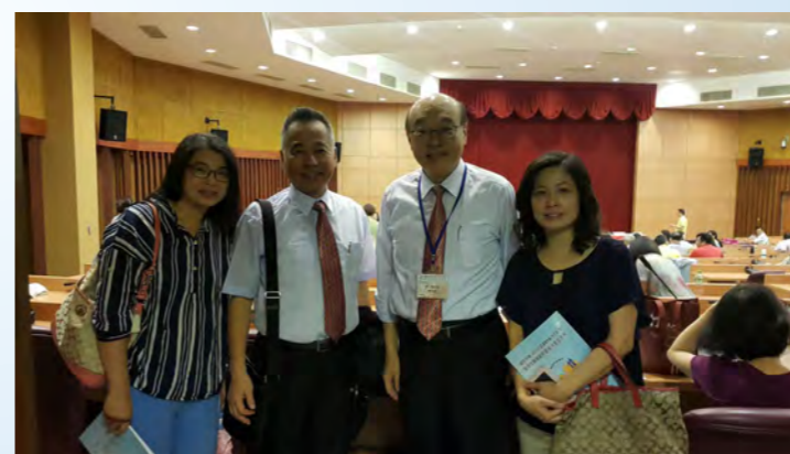
參加RYE青少年長期派遣學生歸國報告