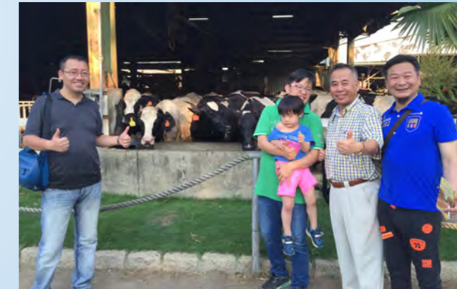
秋季旅遊場地探勘