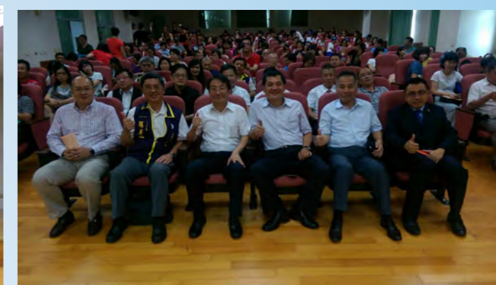
參加光仁中學啟智班成果發表會