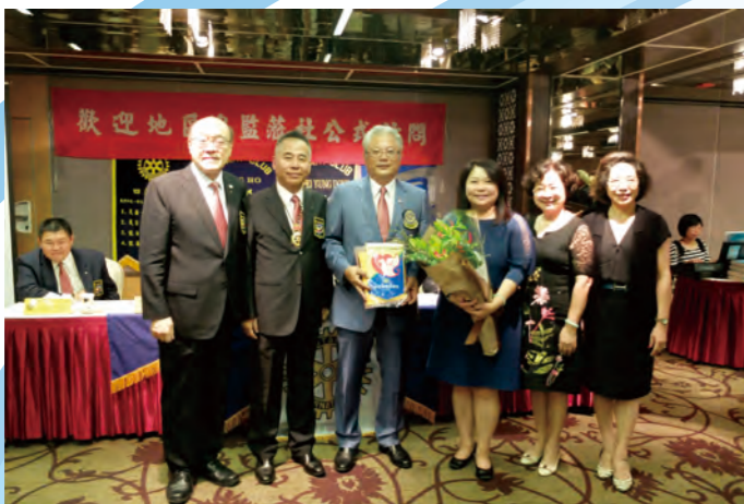
歡迎新社友TOUR徽章入社