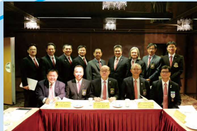
地區總監公式訪問會前會