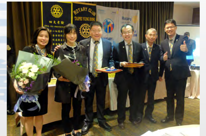
歡迎新社友入社配章