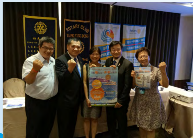
地區資深人力、腎臟病防治委會蒞社宣導