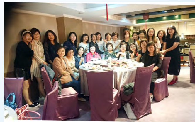
109/9/26舉辦第二次爐邊會暨中秋晚會於悅華軒港式餐廳