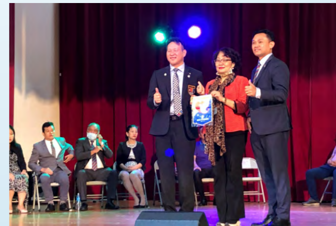
109/9/26舉辦第四分區聯合校園反毒活動於永和秀朗國小