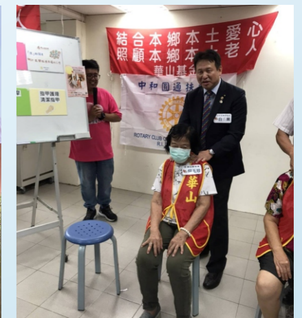
參加關懷華山老人基金會服務