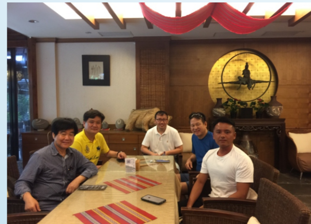
秋季旅遊、職業參訪場地探勘