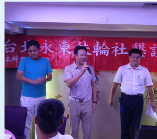
109/7/25 White社長主辦第一次爐邊會於一郎日本料理

曾任： 行政院研考會諮詢委員、內政部治安委外民調評議委員、警政署治安顧問、行政院人力發展中心、國軍將官班講師、第三屆國大代表