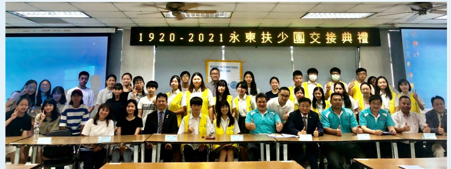
2020/7/18於中和高中舉行2020-21 台北永東扶少團團慶