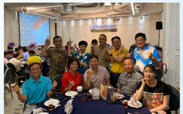
參加雙和隊會長交接晚會