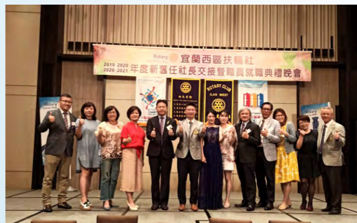
參加宜蘭西區社社長交接晚會

【經歷】 閱讀生活有限公司總經理、閱讀人社群 創辦人 閱讀主編 【經歷】 華人閱讀人社群創辦人，為目前華人閱讀類最大的粉絲團，人數達114萬人 每週直播、貼文觸及人數達百萬，並邀請王文華、賴佩霞、Power焜、HowHow等名人 同台開講聯合報專欄作家、Cheers工作人專欄作家、2014文化部文創之星首獎、 2014新閱讀運動閱讀大使、入選國際SLP創業組織、入選社企流i-Lab計畫 計程車創新學院顧問、勝捷科技公司顧問、國際扭轉力學院顧問、黃金一哩企業 顧問、新北創力坊新創顧問、公益平台 合作夥伴、國家文官學院評審委員、 高屏澎東分署計劃諮詢委員、CMP行銷企劃師認證委員