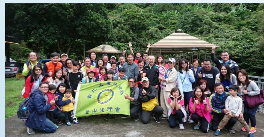
10/24 永東登山會～信賢步道健行