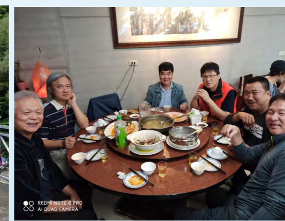
10/24 永東登山會～京旺餐廳午餐