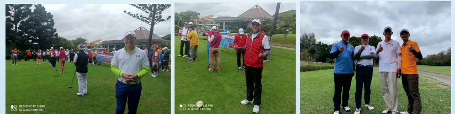
11/9參加地區年會慈善高爾夫聯誼賽於台北球場

◎3481地區『扶輪日』暨公益園遊會 時間：109年11月21日(六)10:00-16:00 地點：台北華山文化創意產業園區A、B區 地址：台北市台北市中正區八德路一段1號 ◎3481地區「End Polio暨反毒慈善音樂會」 時間：109年11月28日(六)19:00-21:00 地點：國父紀念館大會堂 地址：台北市信義區仁愛路4段505號 ◎2020新加坡亞太研習會將於12/5-12/6在線上舉行，不需要任何費用，大會有中文翻譯，希望大家把握這次的機會、多多註冊參加。以下是註冊的網頁： https://joinnow.my/events/46/register