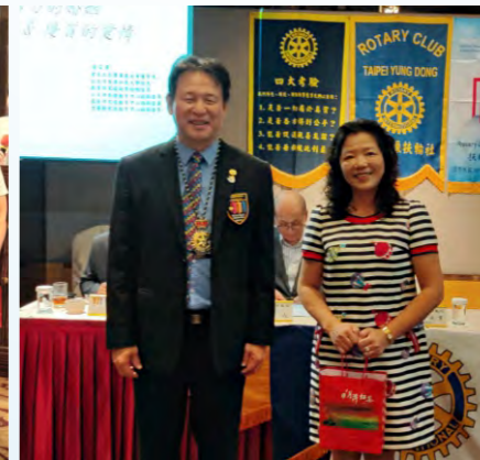
本月結婚週年快樂