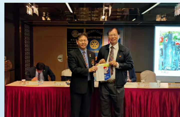
葉倫會老師精彩演講