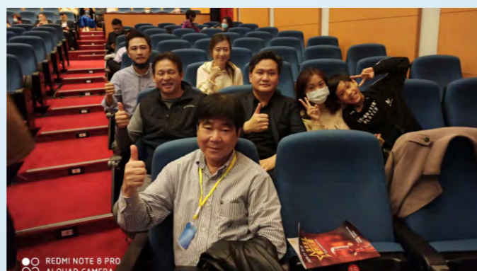
1/23參加扶輪星光大道歌唱比賽