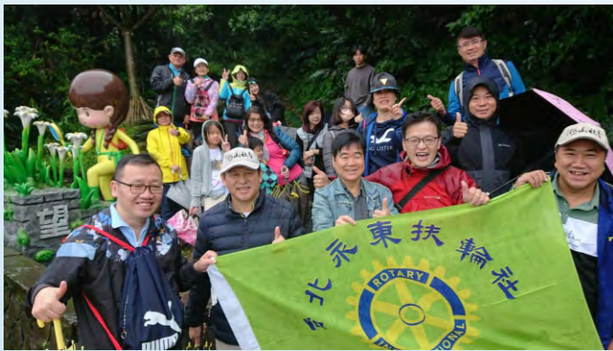
4/10第二次登山會於忘憂谷

◎台北永東社與新店碧潭社對抗賽 日期:4月20日(二) 時間:10:22集合、10:52開球 地點:再興球場