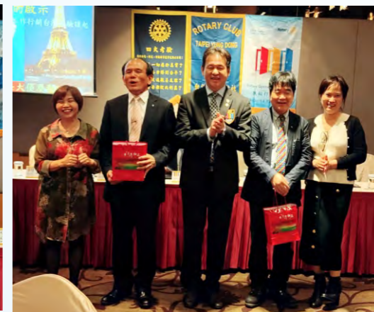
本月結婚週年快樂