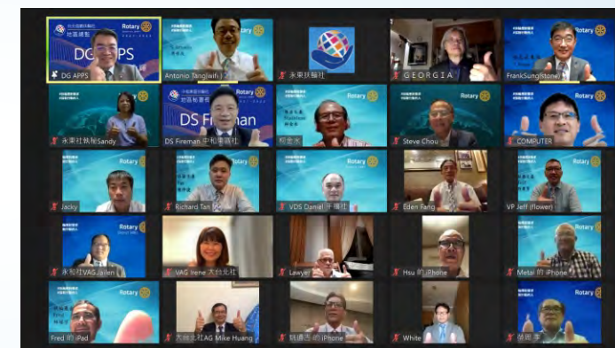
總監公式訪問合影