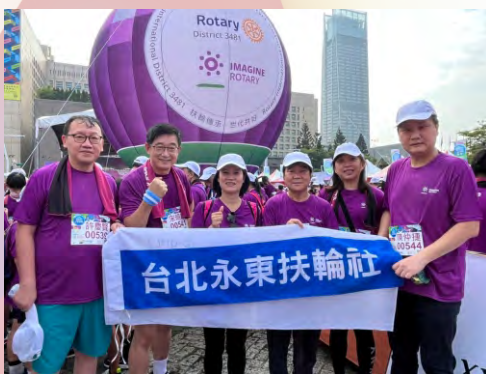
參加扶輪公益路跑於總統府前廣場