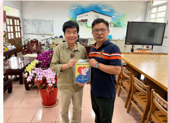
第四分區聯合服務~水資源計畫