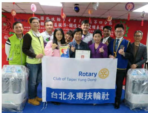
第四分區關懷八里愛維養護中心