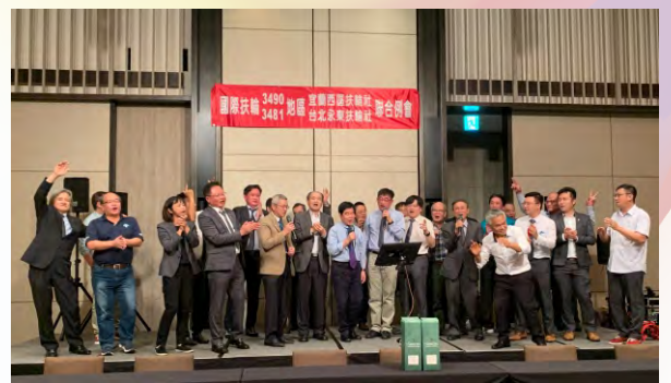
與宜蘭西區社聯合例會