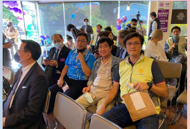
第四分區聯合服務於台北啟明學校