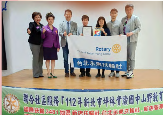
坪林實驗國中教育計畫