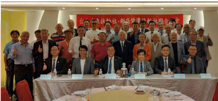
與新店碧潭社聯合例會