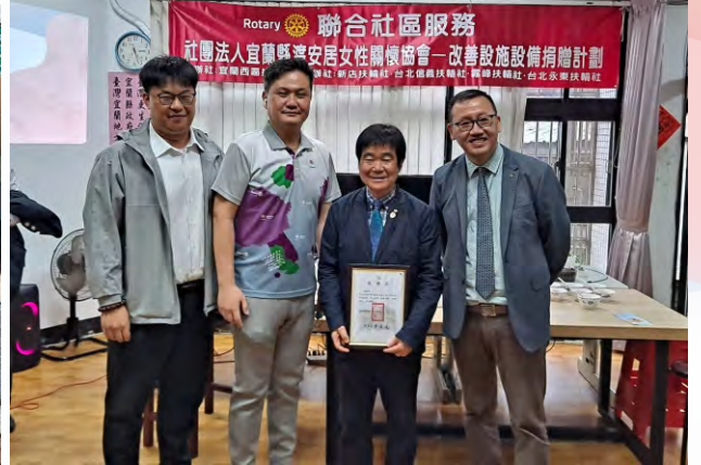
參加宜蘭西區社舉辦聯合服務