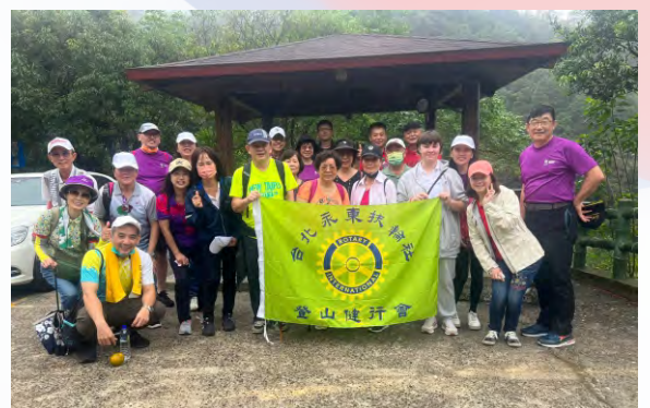
第一次登山會於姜子寮絕壁