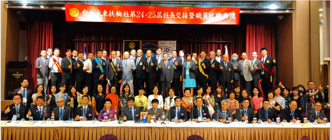
第24、25屆社長交接暨職員就職典禮 11.7.5 於台北福華飯店