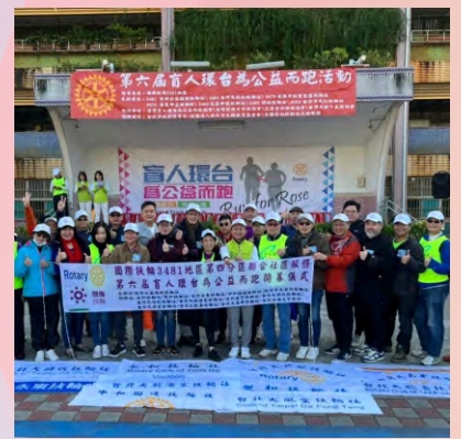
第四分區聯合服務盲人路跑