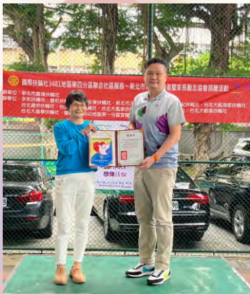
第四分區聯合服務於福和國中