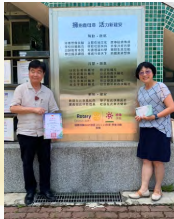
建安國小社區服務