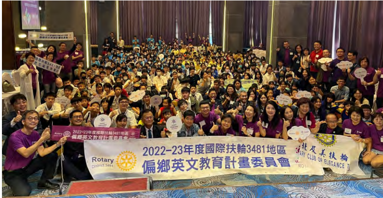
地區偏鄉英文-宜蘭組相見歡活動