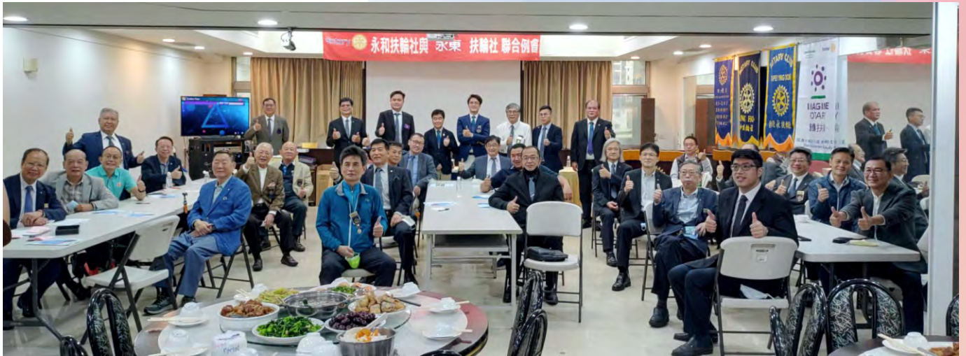
與祿姆社永和社聯合例會於永和社社館