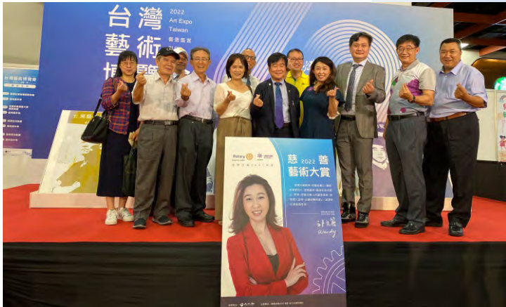
參加台灣藝術博覽會開幕式