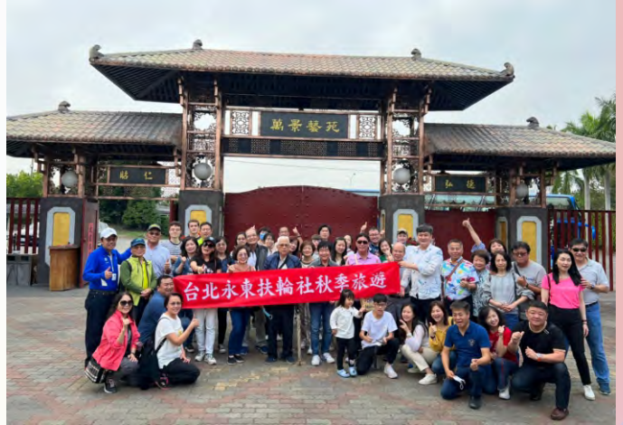
秋季旅遊日月潭、彰化