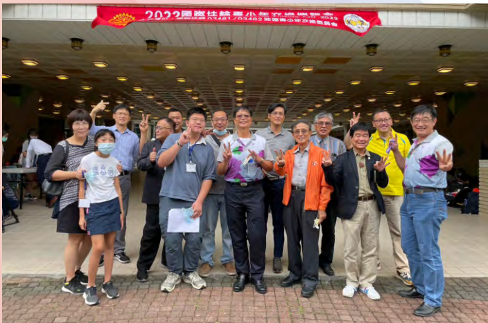
參加青少年交換派遣學生甄試