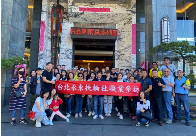
職業參訪-大振豐洋傘