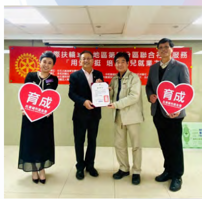
第四分區聯合服務用愛挺憨兒