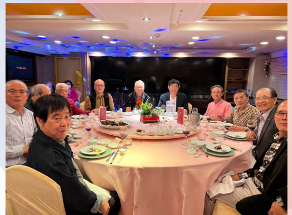
召開顧問委員會於歐華酒店