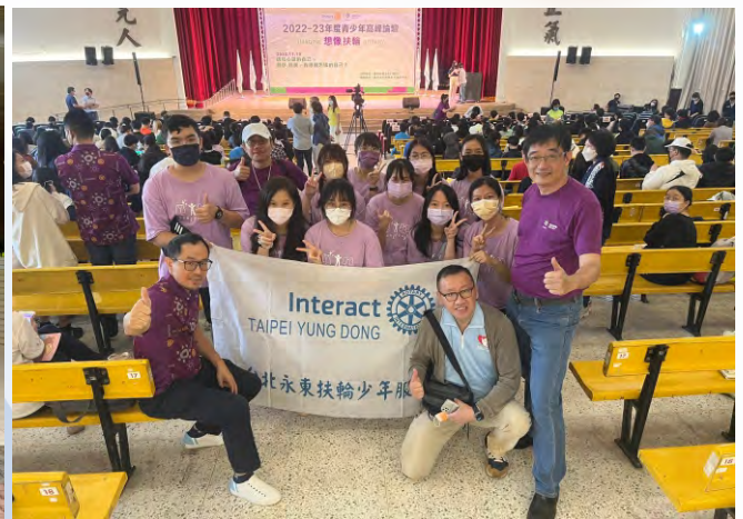
參加青年高峰論壇