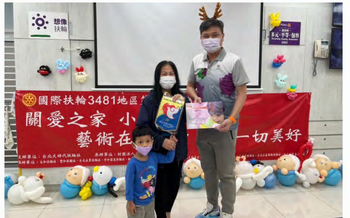
第四分區聯合服務於關愛之家