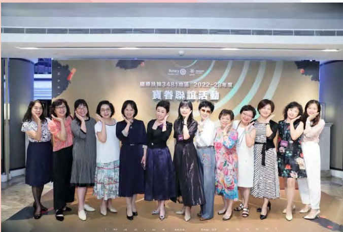
參加地區寶眷聯誼活動