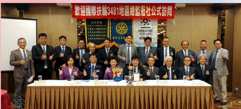
總監公訪全體社友合影