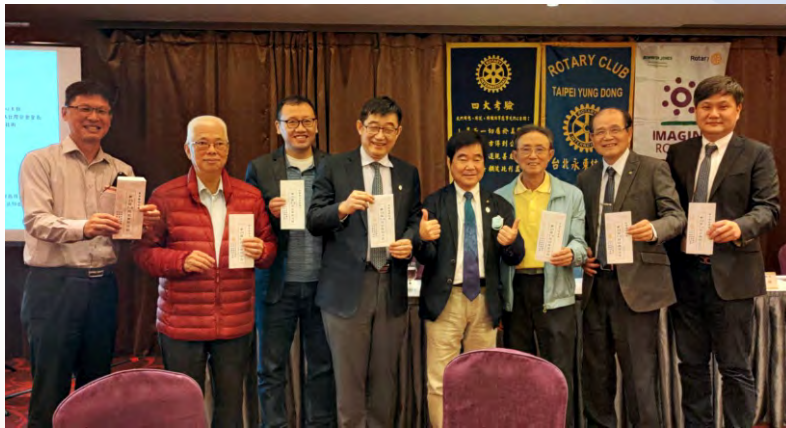
頒發7-9月出席百分百社友