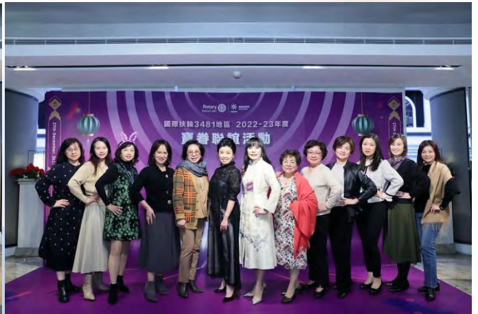
參加地區寶眷聯誼活動