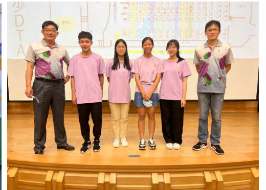
台北永東扶少團參加3481地區活動