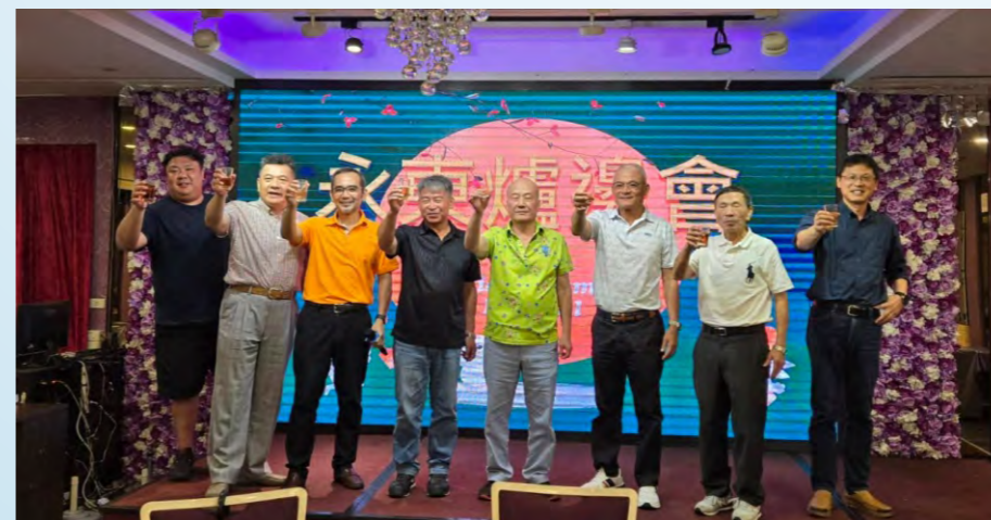
9/14舉辦第二次爐邊會暨中秋晚會於一郎日本料理