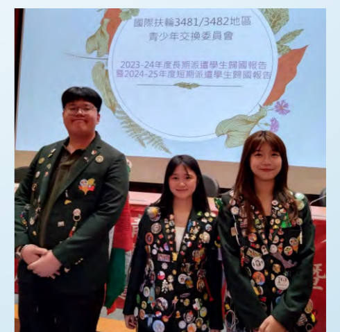
2023-24RYE交換學生歸國報告