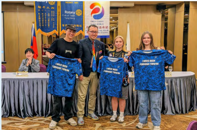
社長致贈扶輪紀念T恤