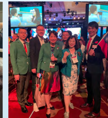
2024/5/25-29 參加2024新加坡扶輪世界年會