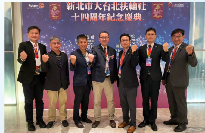
參加大台北社授證晚會