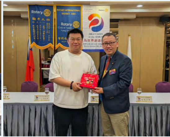
恭賀Ichilong社友喜獲千金